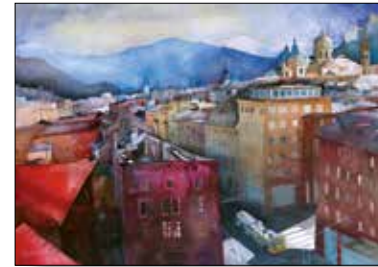
MOTIV 20-23 Blick in die Griesgasse Johnna Kopp