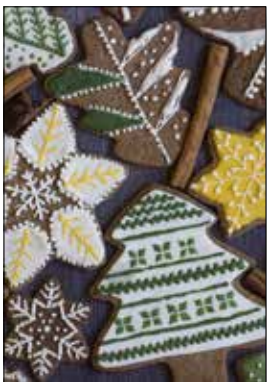
MOTIV 21-06 Weihnachtliche Grüße