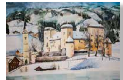
MOTIV 20-37 Schloss/Kirche Goldegg Johanna Kopp